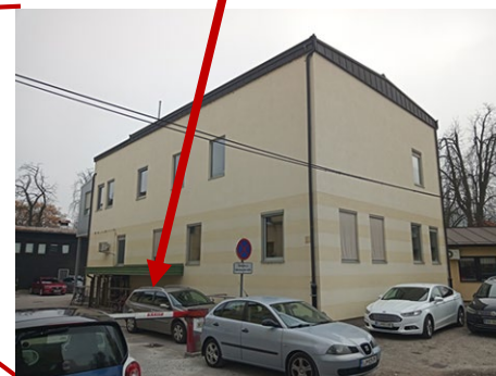
Vhod v Mala vajalnico po stopnicah v klet