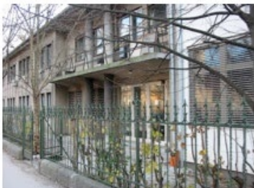
Vhod v Veliko vajalnico z Zaloške ceste