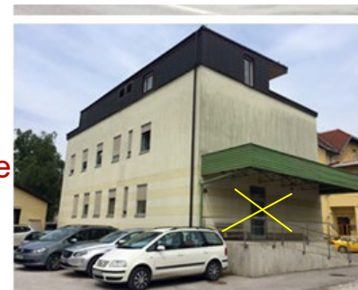
Vhod v Malo vajalnico , desno okrog vogala in po stopnicah v klet