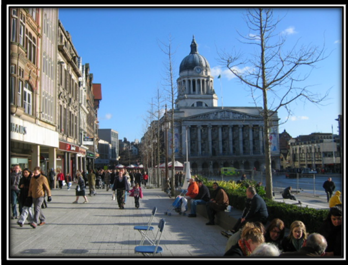
Slika 1: Old Market Square

Glavni trg, Old market square , na katerem se nahaja mestna hiša, je odlično izhodišče za pohajkovanje po mestu. Sprehodite se lahko do Galleries of justice , nekoliko strašljivega muzeja, do Nottinghamskega gradu, imenovanega tudi The big house , saj je bil v preteklosti tolikokrat požgan do tal, da ni od srednjeveškega gradu ostalo niti sledi, na njegovem mestu pa stoji večja graščina iz 18.stoletja, kjer si lahko ogledate različne razstave, pred njim pa stoji tudi bronast kip Robina Hooda.