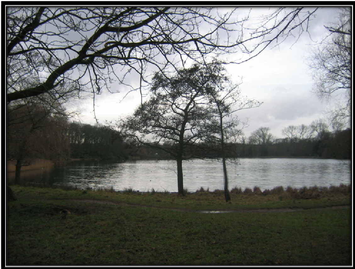
Slika 5: Wollaton park

Za konec pa še opozorilo. Nottingham je dokaj varno mesto, vseeno pa se samotno pohajkovanje sredi noči po zapuščenih delih mesta odsvetuje. Raje uporabite taksi, eden izmed cenejših je: 00441159705705 .