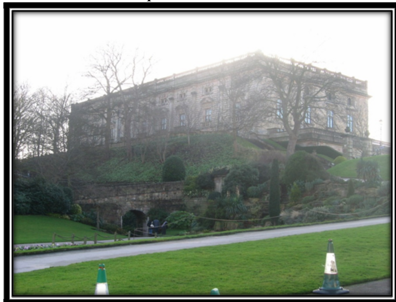
Slika 2: Nottingham castle

Ice arena (Nottingham arena) podnevi ponuja možnost drsanja, ponoči pa se prelevi v koncertno dvorano, kjer pogosto nastopajo svetovno znana glasbena imena. Če pa ste pristaš klubske scene in še neveljavljenih skupin, se bo v klubu Rock City zagotovo našlo tudi kaj za vaš okus.