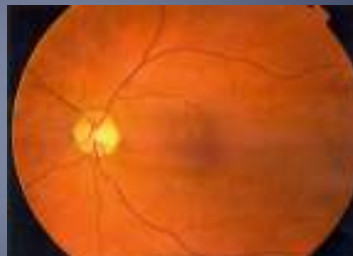
Slika 1. Aterosklerotične spremembe ožilja na očesnem ozadju.