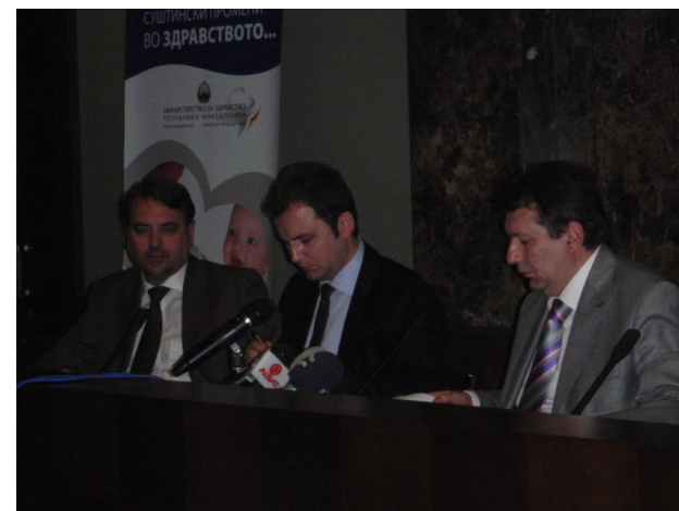
Memorandum za suradnju MF/MZ 2009