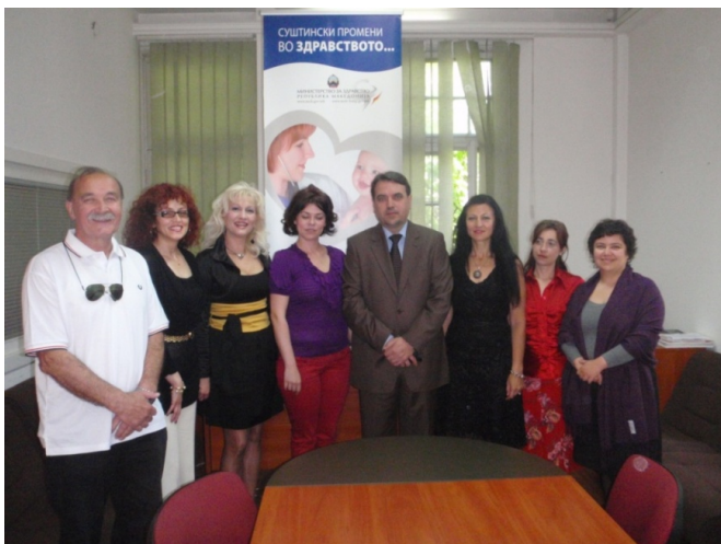
Proektna edinica 2004-2010