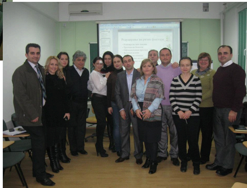
Drugi medfakultetni sastanak katedra obiteljskog medicina »Splitska inicijativa« 29-30.03.2013 Ljubljana