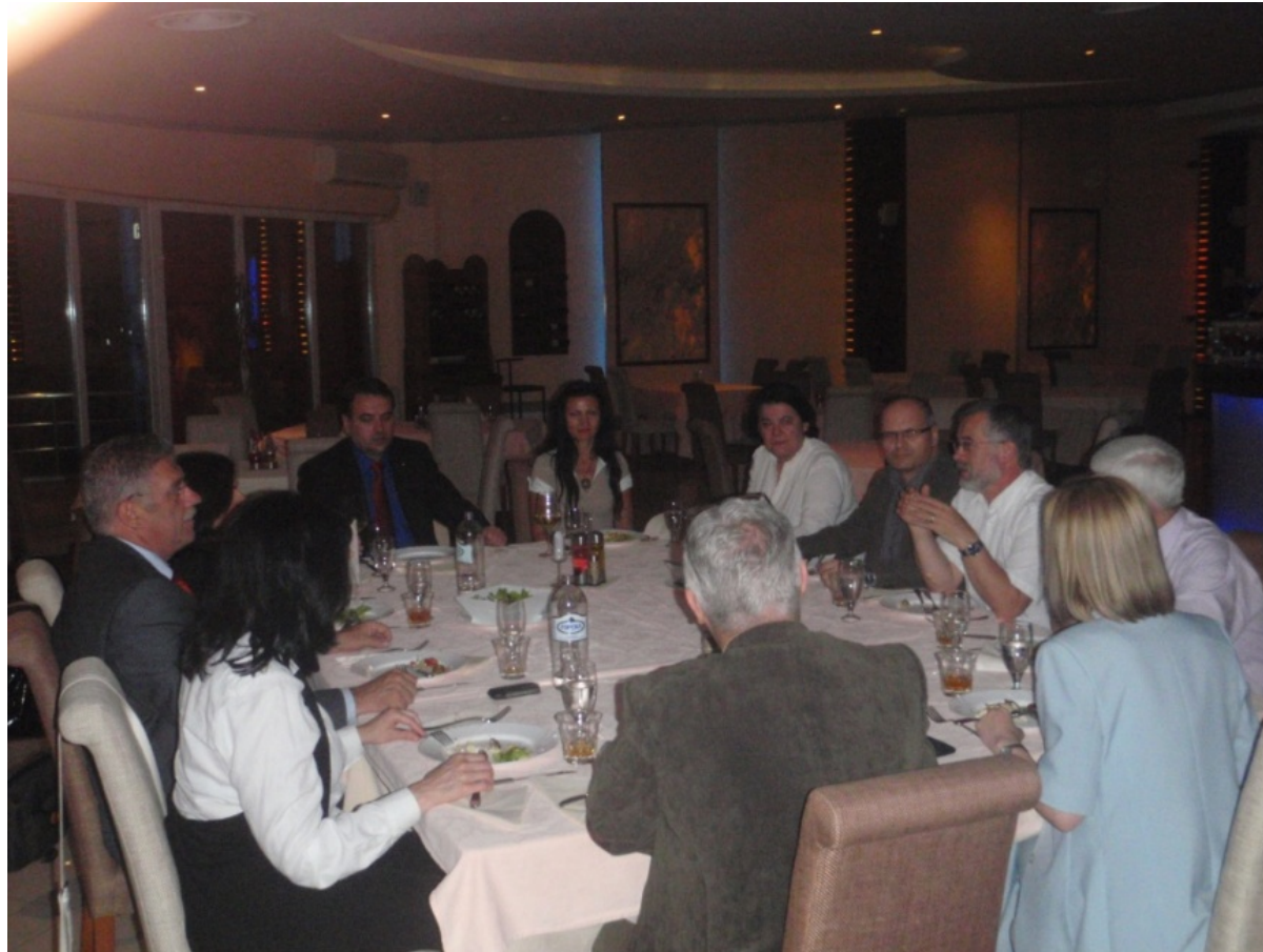
Drugi medfakultetni sastanak katedra obiteljskog medicina »Splitska inicijativa« 29-30.03.2013 Ljubljana