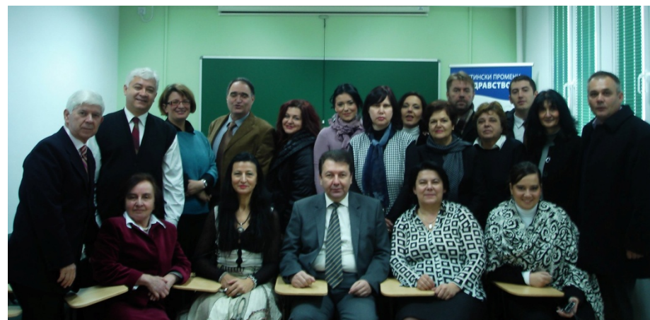
Drugi medfakultetni sastanak katedra obiteljskog medicina »Splitska inicijativa« 29-30.03.2013 Ljubljana