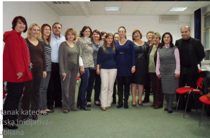
Drugi medfakultetni sastanak katedra obiteljskog medicina »Splitska inicijativa« 29-30.03.2013 Ljubljana