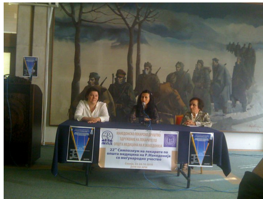
22 Simpozium lekara opste medicine Makedonije Katedra obiteljske medicine 2010