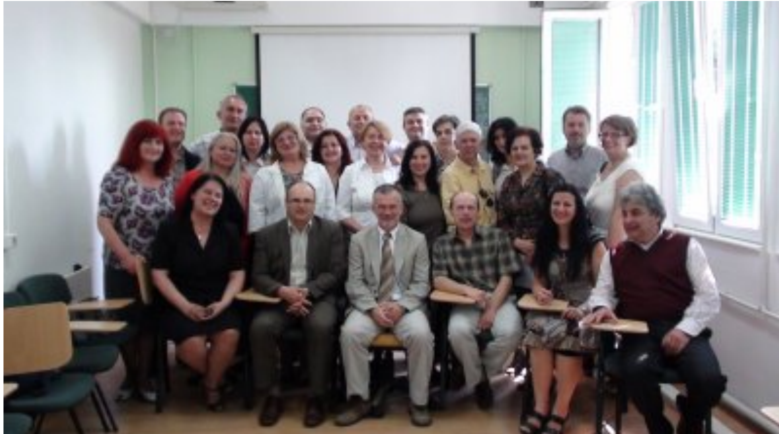
Drugi medfakultetni sastanak katedra obiteljskog medicina »Splitska inicijativa« 29-30.03.2013 Ljubljana