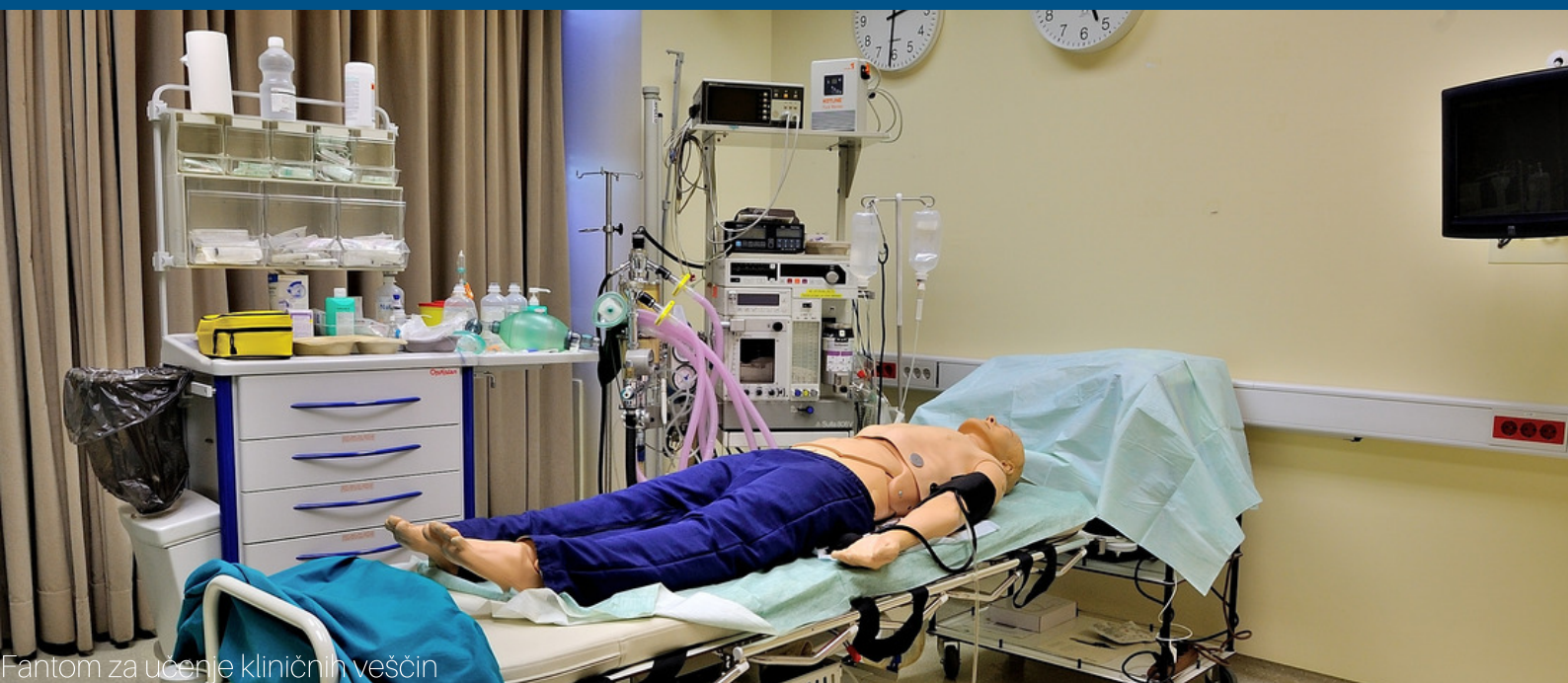
Fantom za učenje kliničnih veščin

V kliničnem delu študija se študenti lahko vključijo v mednarodno rotacijo, v okviru katere študij poteka v angleškem jeziku.