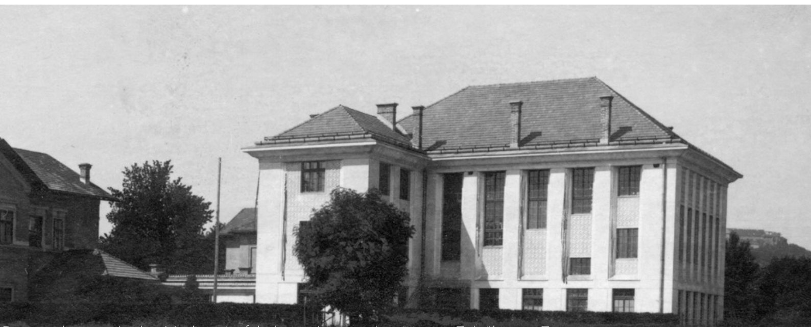
Prva stavba nepopolne Medicinske fakultete - Anatomijski inštitut na Zaloški cesti 7

Medicinska fakulteta Univerze v Ljubljani je mednarodno odprta in priznana inštitucija, ki v skladu s predpisi države, univerze in fakultete izvaja nacionalni program visokega šolstva in nacionalne raziskovalne programe na področju biomedicine. Medicinska fakulteta Univerze v Ljubljani je skupnost visoko usposobljenih in izkušenih učiteljev in asistentov predkliničnih in kliničnih strok, študentov in drugih sodelavcev, ki s skupnimi močmi aktivno oblikujejo kakovosten in mednarodno uveljavljen študij medicine in dentalne medicine.